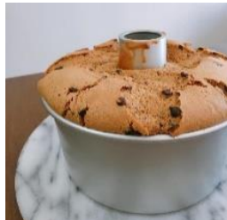
かんたん珈琲チョコチップ