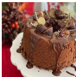
かんたんふわふわチョコシフォン