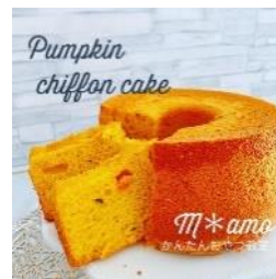
ゴロゴロ生かぼちゃシフォン