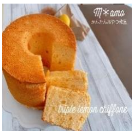
トリプルレモンシフォン