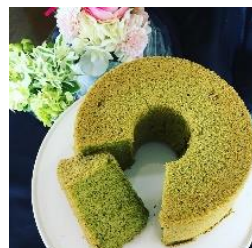
ふわふわ抹茶シフォン