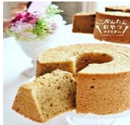
かんたん紅茶シフォン