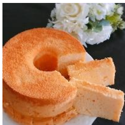
クリームチーズシフォン